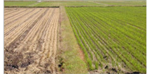
土壌を悪くする発芽がおこらず