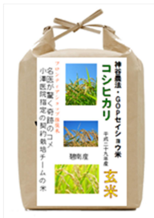
写真イメージです

重病の入院患者が続々と自己回復して退院。医師が驚いて証明書を発行した、進化した農法で作られた奇跡の米が今年も出荷されています。