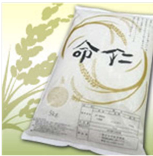
種の優性遺伝が受け継がれる米 命仁 (みょうじん)

その美味しさ、チカラを引き出すために、あえて量産を控え、妥協することなく丹念に手間をかけてつくられたお米です。