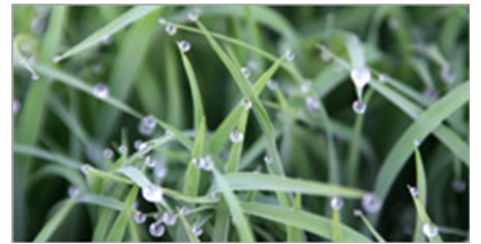
水滴がきれいな球になる力のある稲