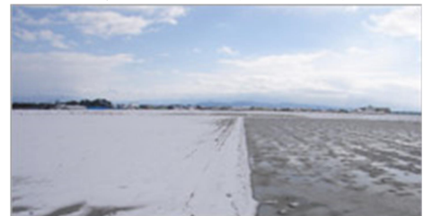
雪解けに差が出る豊かな土壌

玄米黒焙煎茶 (げんまいくろばいせんちゃ) は、「命仁」のみを100%原料としたお湯に溶かして飲んでいただく飲み物です。